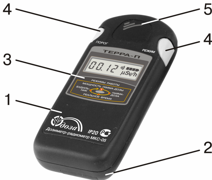
Рисунок 1.1 - Общий вид дозиметра

Дозиметр выполнен в плоском прямоугольном пластмассовом корпусе с закругленными углами.